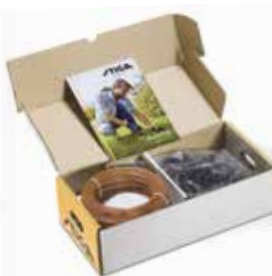
9 Installationssæt, lille