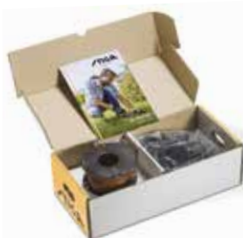
8 Installationssæt til 200- og M-serien