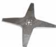
2 Kniv til 500-serien