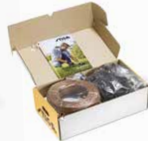
10 Installationssæt, stort