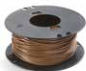
1 Kabel til 200- og M-serien

For at sikre den bedste ydeevne skal Autoclip robotplæneklippere gennemgå en omhyggelig installationsprocedure. Til dette formål tilbyder STIGA alle relaterede installationsmaterialer. Du har mulighed for selv at installere din robotplæneklipper, eller du kan få installationen udført af en Autoclip-specialist. Læs mere på næste side.