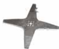
1 Kniv til 200- og M-serien