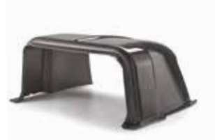
3 Garage til 500-serien