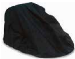
1 Overtræk til Autoclip

En garage beskytter din robotplæneklipper mod sol og regn.