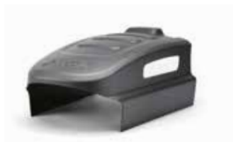
2 Garage til 200- og M-serien